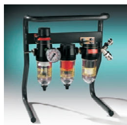
Banco de filtrado