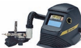
Eye-Tech + AC