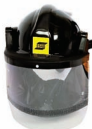
Casco para desbaste atomizado