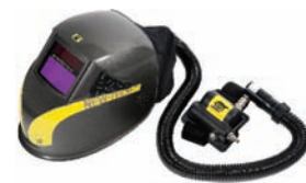
New-Tech + AC